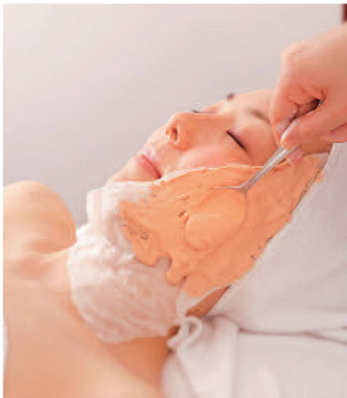
▲「むくみを撃退したい」56種類の栄養を含むパックで引締まった顔周りに