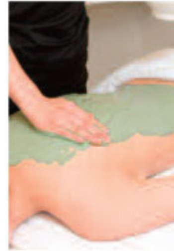
▲プランと特典ケアの組み合わせでキレイに

人気オプションから2種類のケアを進呈！ ■デコルテパック ■二の腕パック ■背中パック ■背中美肌ケア ■二の腕美肌ケア 各オプションは悩みや希望に合わせて美肌パックやたるみケア等を用意。1万2600円相当 【対象】2010年以内に成約で2011年3月1日以降に挙式予定の花嫁