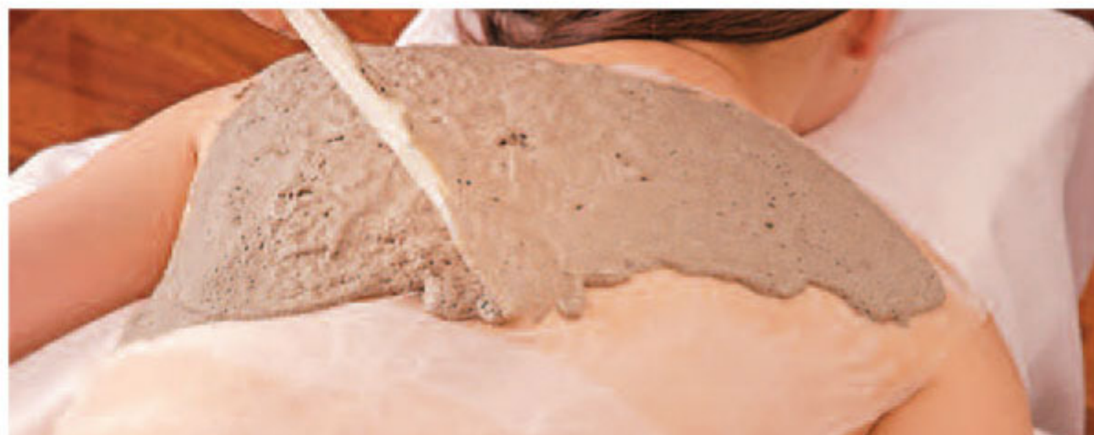
▲「引締まったツルツル肌になりたい」海藻成分豊富なパックで代謝をアップ