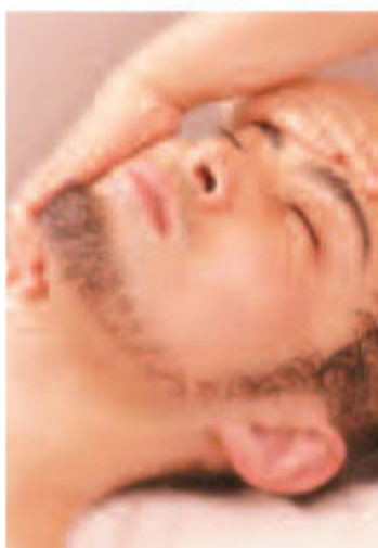
▲メンズプランは、花嫁エステにも掲載中

彼が1回でもメニューを成約すると、花嫁のコースにオプションで一番人気の【二の腕パック】 or 【デコルテパック】1回分(6300円相当)をサービス。ふたりで素敵になろう