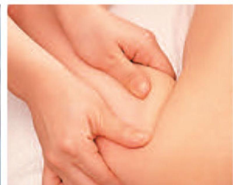
▲たるむ肉・筋肉質な肉など、肉質によってマッサージ法・時間配分を変えて丁寧にみほぐすプロの技