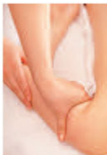
▲肉質で時間の配分を変えるのがポイント

効果の秘密は引締めマッサージの内容。花嫁の肉質によって【ほぐし】と【流し】の配合を変える。この時に必要なのは、カウンセリングと肌触りから見極めるプロの目！