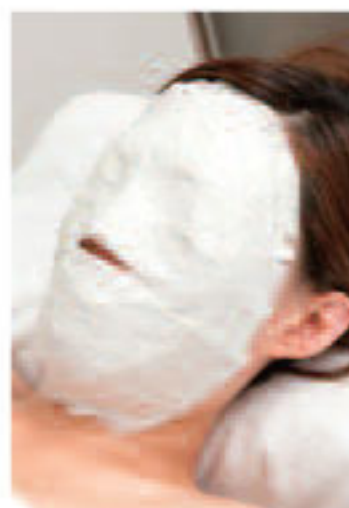
▲石膏の温熱効果は、くすみにも効果的

顔の引締めは肌を上げるようにマッサージ。たるみ具合で力や回数を考えながら、キュッと持ち上げる。むくみにも効果的で小顔に。輪郭を引締める石膏パックもおすすめ