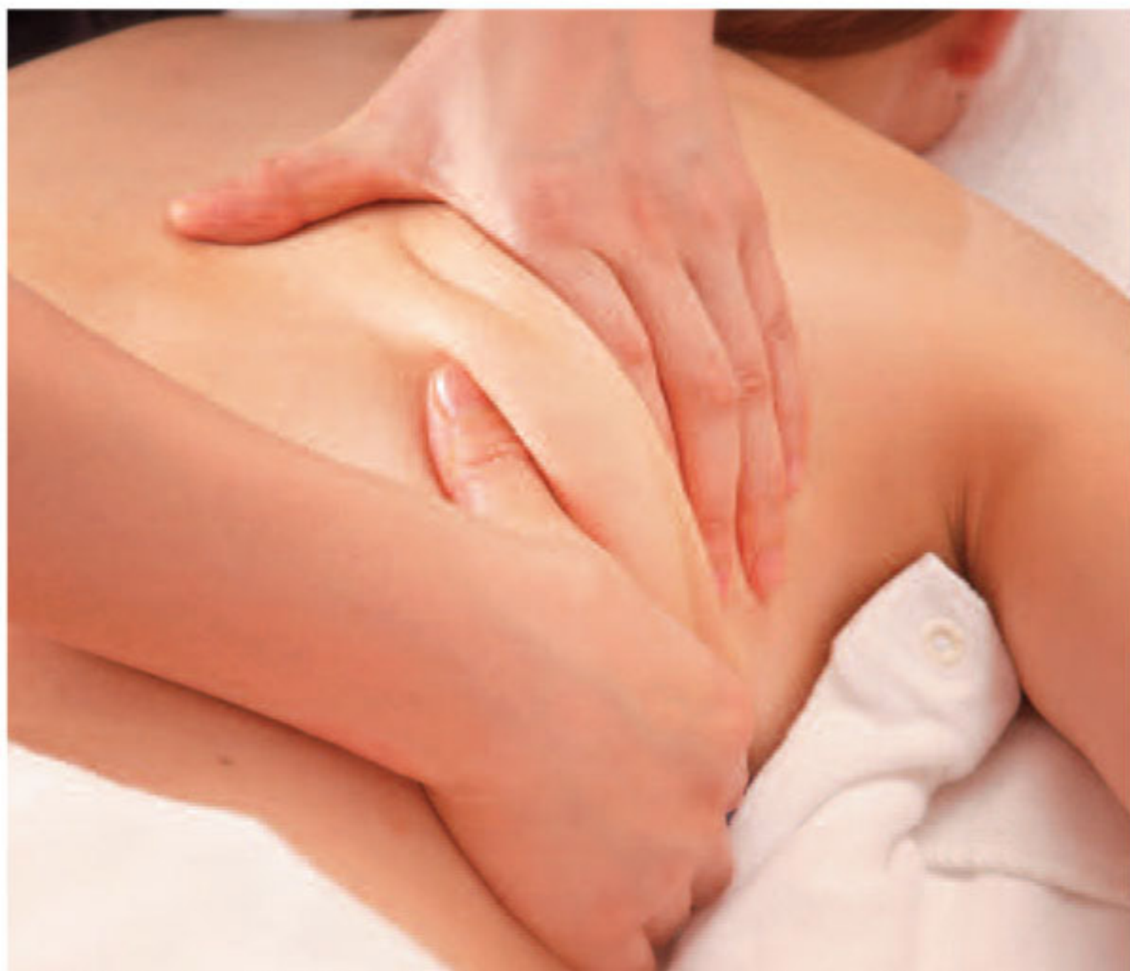
▲「露出度の高いドレスを着こなしたい」肩甲骨のムダ肉を絞るように押して、リンパの流れを活発に