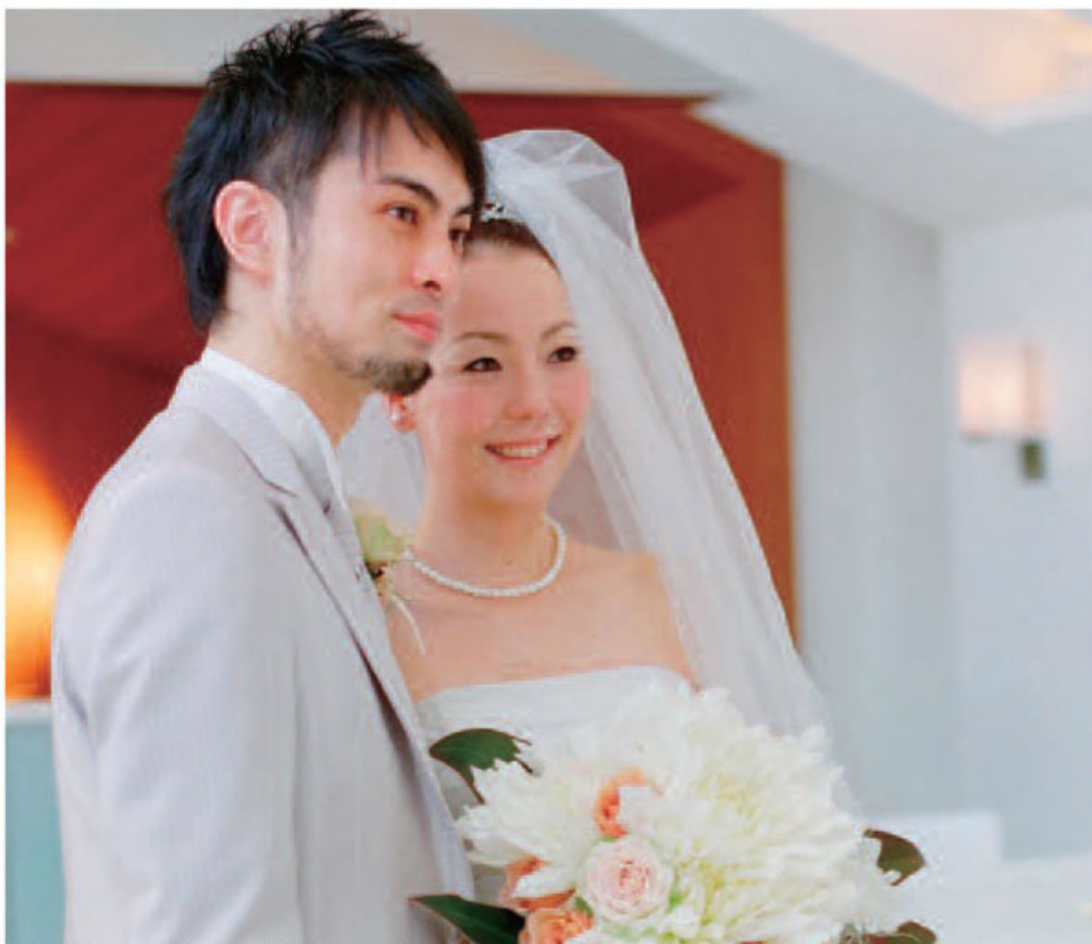
▲親戚、友人、職場関係…当日は皆から熱い視線が。彼をいい男にするのは妻の務めなのかもしれない