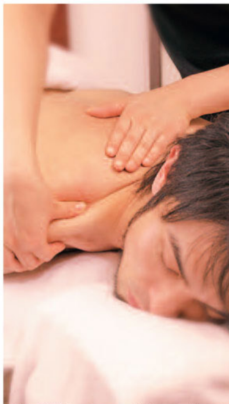
▲普段、体験しないサロンでの快適ケアは、体のコリをほぐすだけでなく、精神的にもリラックスできる