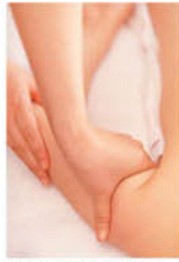
▲カウンセリングと肌で見極めるプロの技だ

秘訣はマッサージ。運動をしていた人・ダイエットを繰り返した人等、肉質により【ほぐし】【流し】のマッサージ配分を変更。花嫁毎に異なる蓄積されたムダ肉を集中ケア!