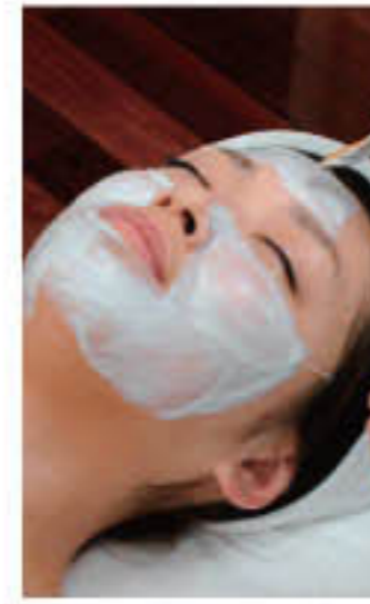
▲悩みに合わせて美白パックなどもOK