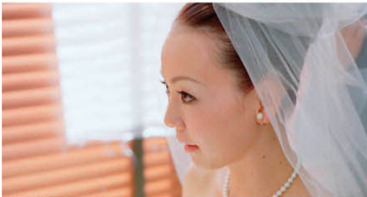
▲【当日】頬の位置・あごのラインにムダがなく、ゲストがうっとりする美しさへ