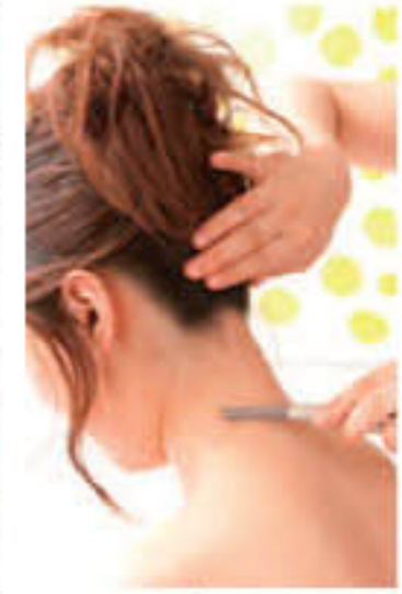
▲磨きあげた肌をつややかに仕上げよう!