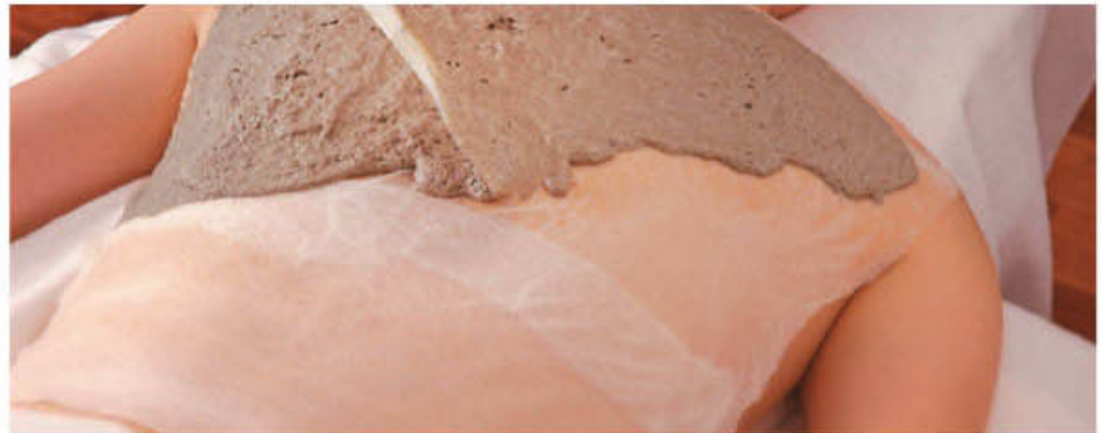
▲塗るとじわじわ発汗する引き締めパック。海藻成分が、つるんとした肌に導いてくれる