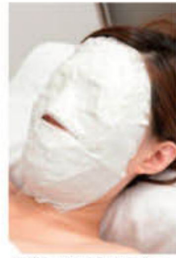
▲他にも悩み別にパックを提案してくれる

年齢によるたるみ・肌の状態から力や回数を変えてキュッと持ち上げるマッサージがポイント。輪郭を引き締めるだけでなく、くすみにも効果的な石膏パックもオススメ