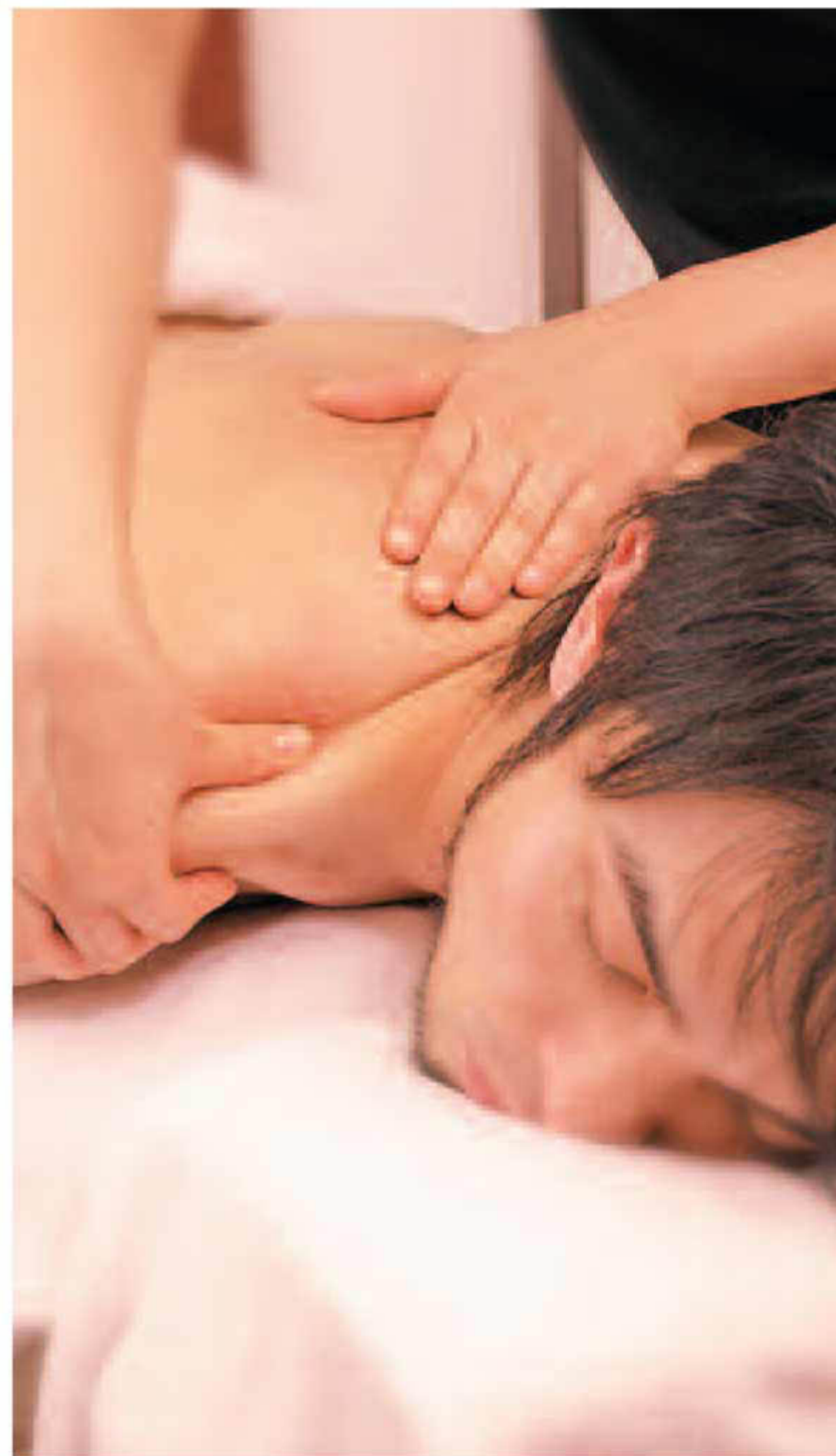
▲普段、体験しないサロンでの快適ケアは、体のコリをほぐすだけでなく、精神的にもリラックスできる