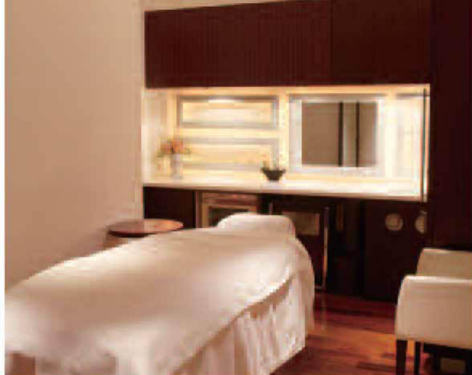
▲プライベートな個室 / 「せっかくだし、ちょっと贅沢もありかな」なんて彼からの意外な反応もあるそう