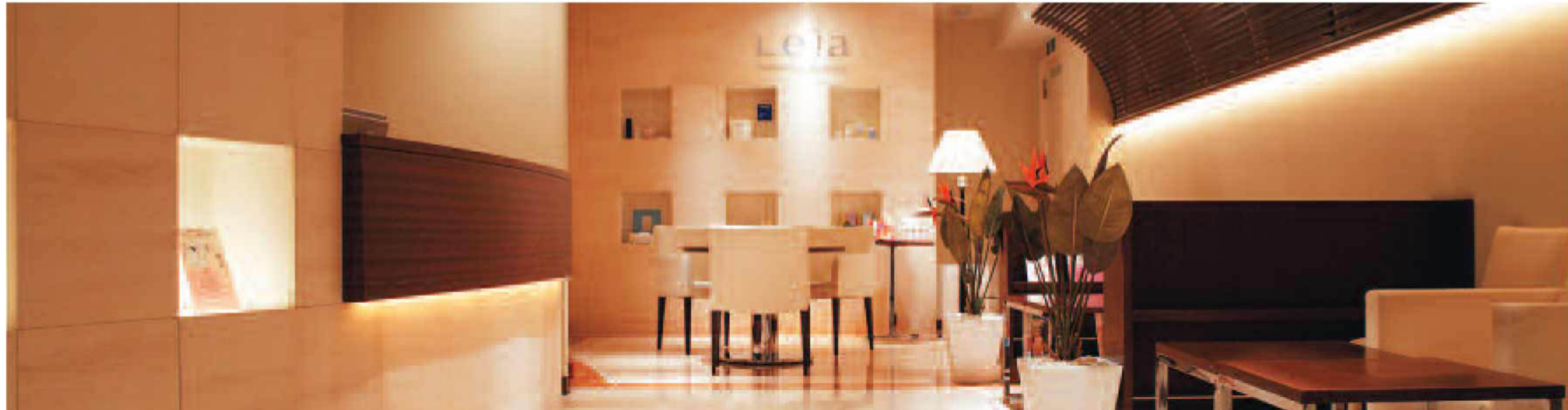
▲銀座で夜21時まで営業しているから、彼と待ち合わせて仕事後のケアをするのも可能。終盤のケアに彼と一緒に連れていくのがオススメ！