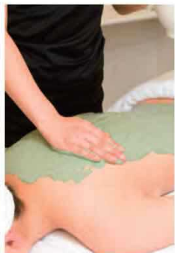
▲仕上げにもこだわりが。美白パックを使用