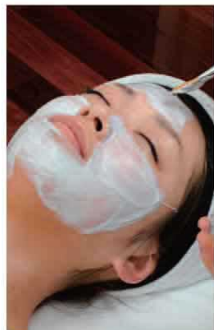
▲悩みに合わせて美白パックなどもOK