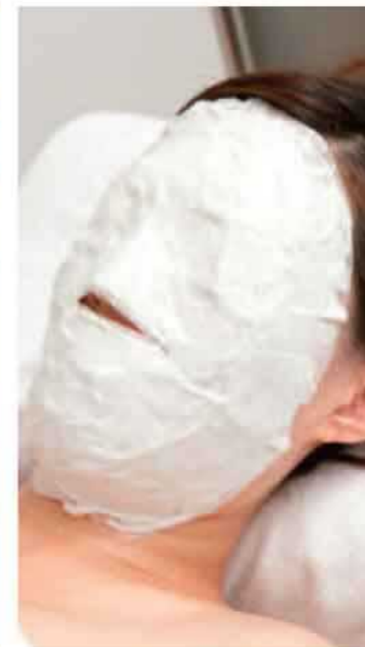
▲温熱効果で引き締まった印象に。くすみ対策も