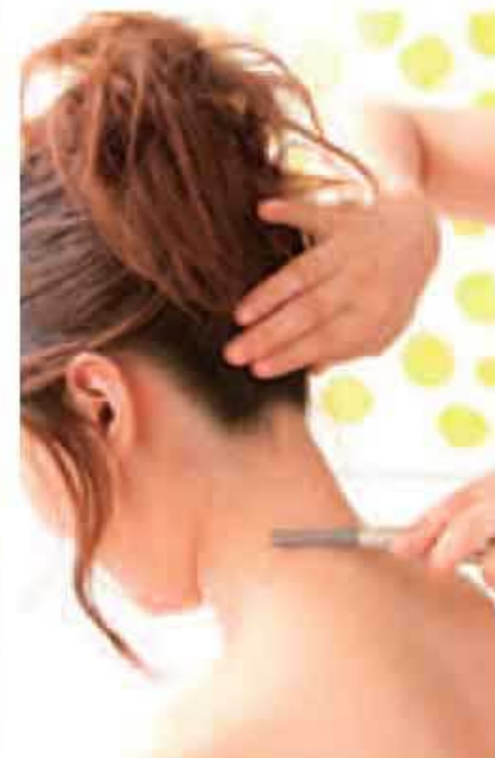
▲磨きあげた肌をつややかに仕上げて!