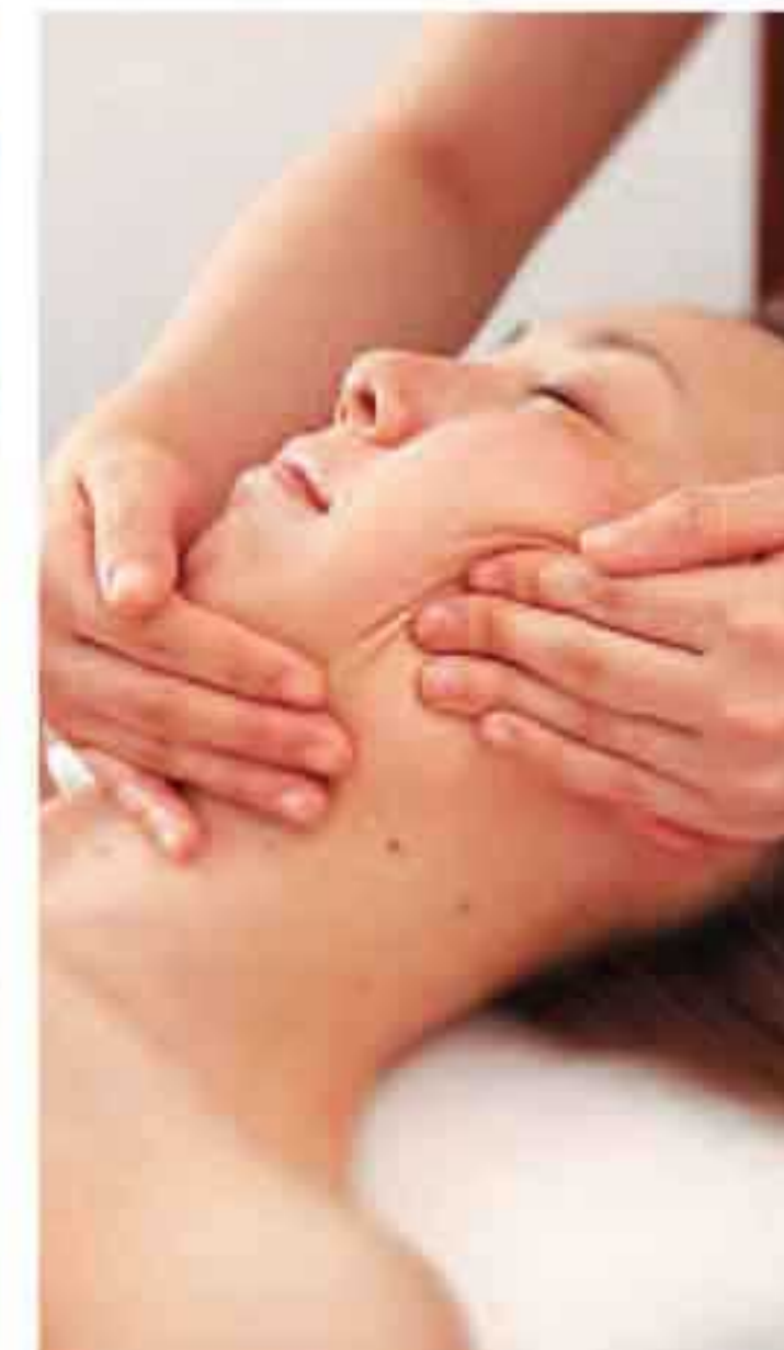
▲顔のたるみにも本気。様々なケアを描いている