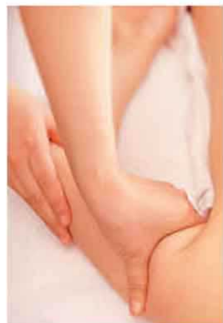
▲肉質で変わる施術方法。※写真は「ほぐし」

【背中】蓄積された肩コリは肩甲骨を隠してしまう。独自のマッサージ・パックで、脇の下のリンパ節に凝り固まった老廃物を流し肩甲骨をくっきりと浮かび上がらせていく。 【二の腕】筋肉質・たるみ肉等、肉質により『ほぐし』『流し』のマッサージ配分を変更。動くたびに揺れるムダ肉をスッキリラインに