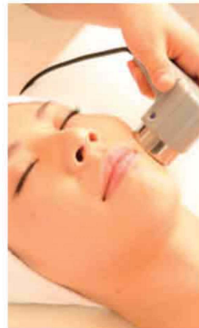
▲美肌や保湿、角質除去等、幅広い肌別ケアも