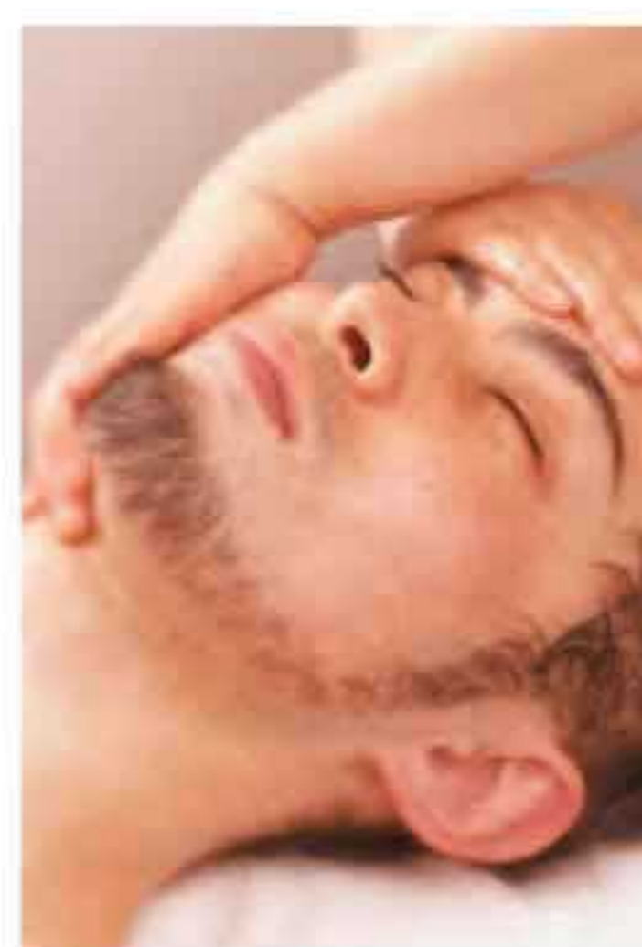
▲ふたりで磨かれた新郎新婦になって！

レイアでは、挙式直前に気軽に通える花嫁ケアが充実。日頃忙しい彼に喜ばれている。実際に通った先輩花嫁のリアルな声を花嫁エステページに掲載中なのでチェックして！