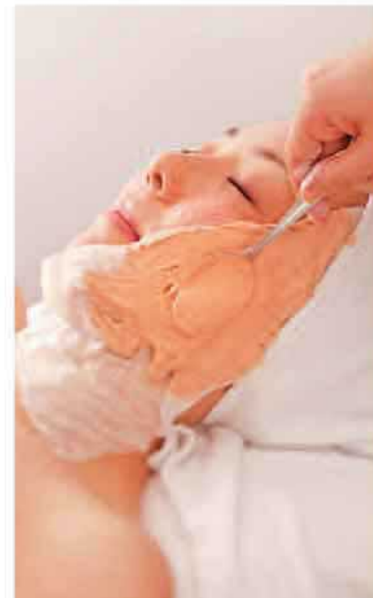
▲石膏パックを下から上へ持ち上げる様に塗布