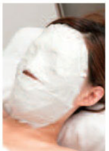
▲石膏の温熱効果は、くすみにも効果的

顔の引締めは肌を上げるようにマッサージ。たるみ具合で力や回数を考えながら、キュッと持ち上げる。むくみにも効果的で小顔に。輪郭を引締める石膏パックもおすすめ