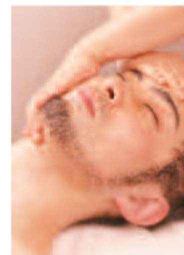
▲メンズプランは、花嫁エステにも掲載中

彼が1回でもメニューを成約すると、花嫁のコースにオプションで一番人気の【二の腕バック】or【デコルテバック】1回分(6300円相当)をサービス。ふたりで素敵になろう