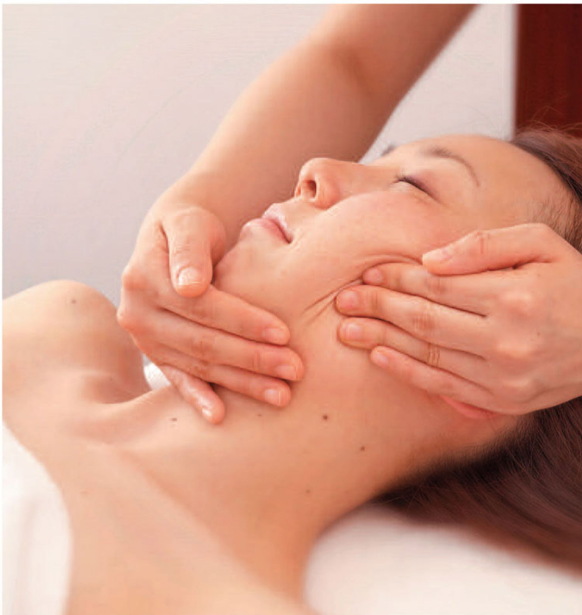
▲「横顔をすっきり見せたい」引き上げながらひねりを加える小刻みなマッサージで、たるみを引締め※写真は先輩花嫁の施術風景