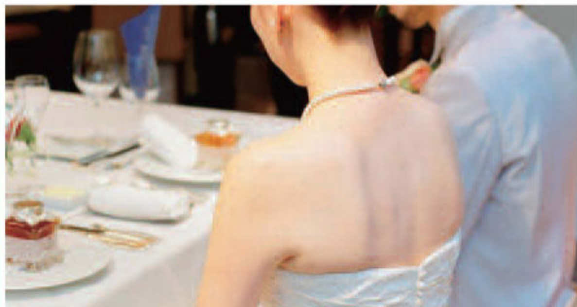
▲【当日】「自分の写真を見て、ツルツルの肌や浮き出た肩甲骨に感激しました」