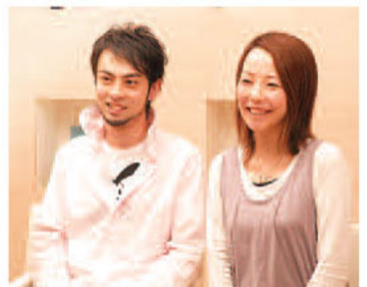
▲「最後はふたりで通ってキレイになりました」