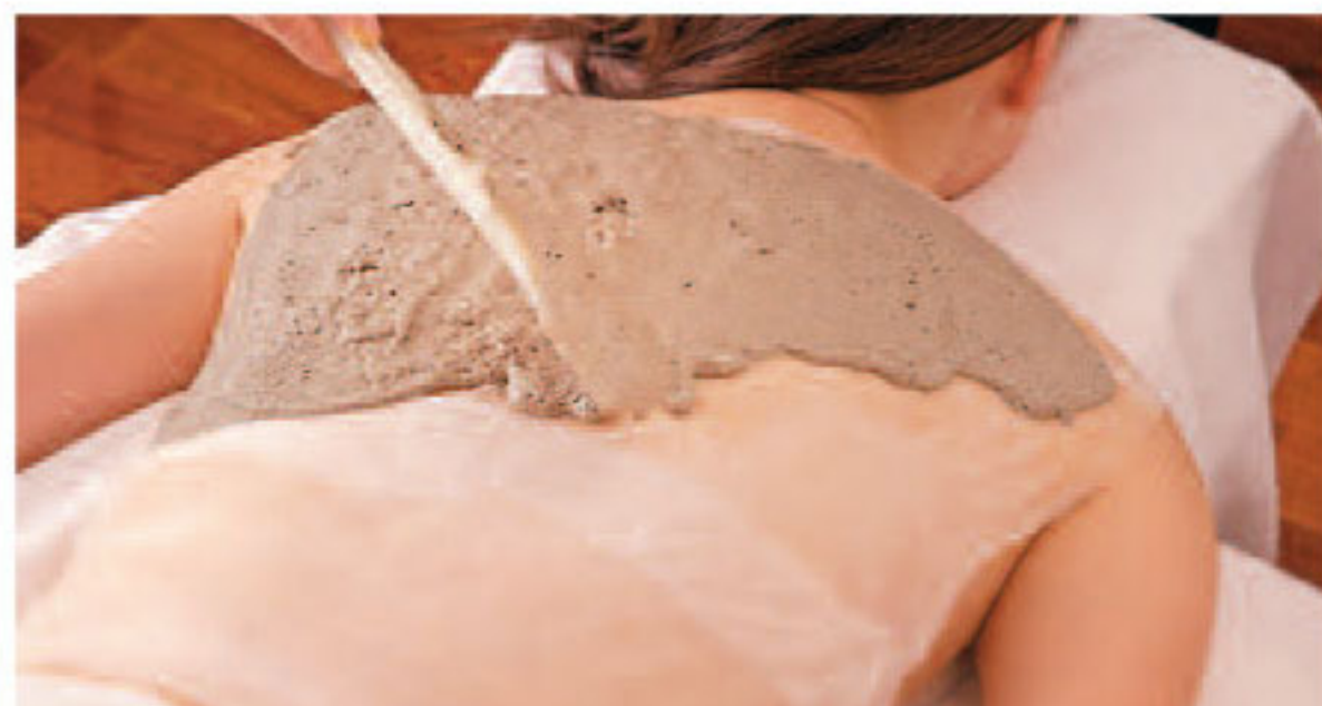
▲「引締まったツルツル肌になりたい」海藻成分豊富なパックで代謝をアップ