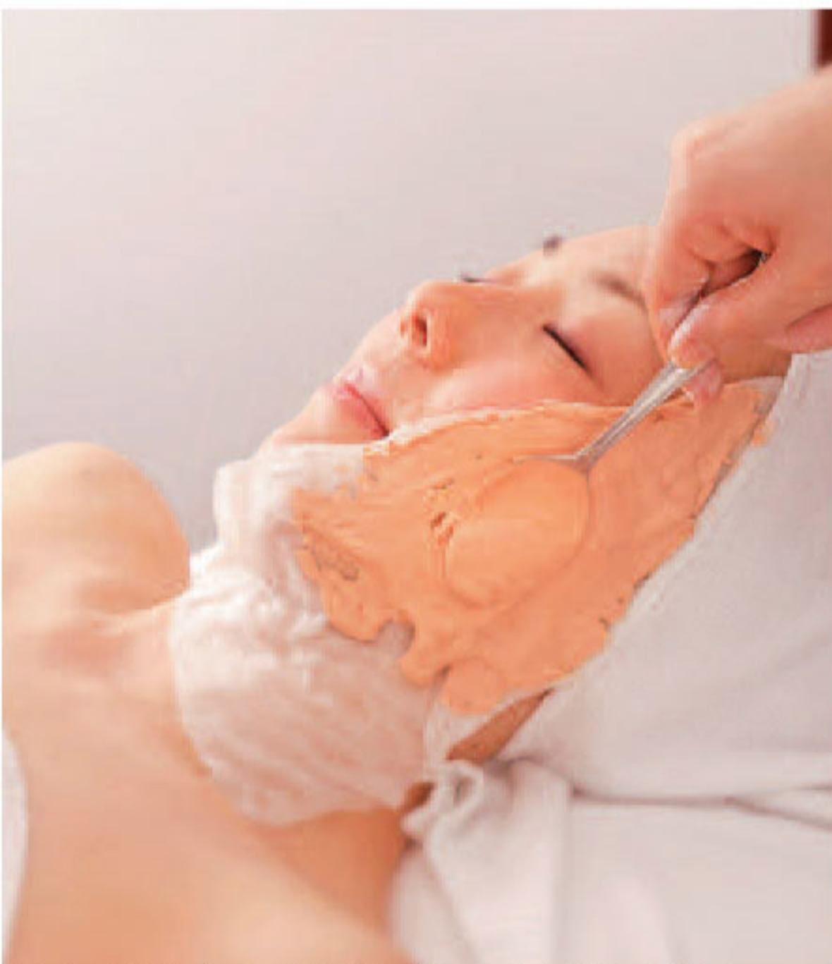
▲「むくみを撃退したい」56種類の栄養を含むパックで引締まった顔周りに